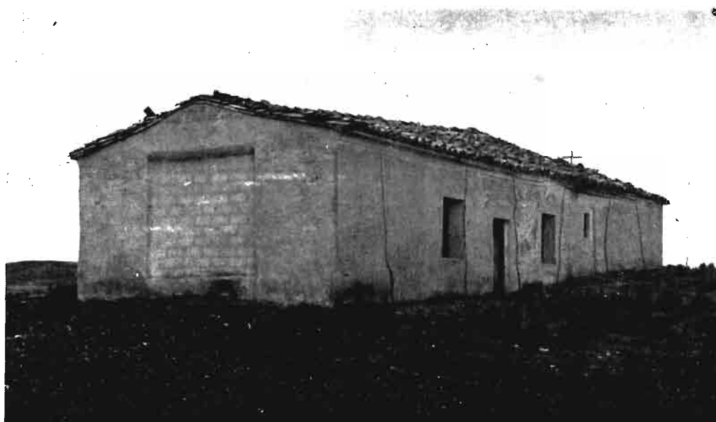
Fotografía núm. 12.—San Pedro Apóstol, de Peralta.