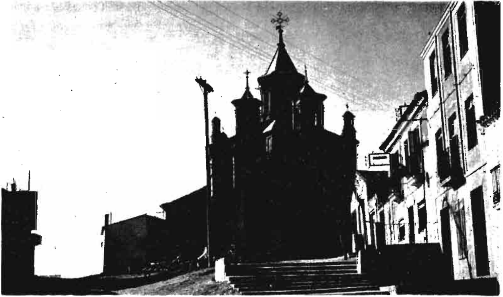
Fotografía núm. 7.—Patrocinio de la Santísima Virgen, de Milagro.