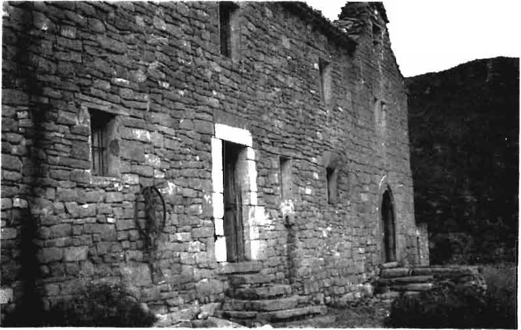
Fotografía núm. 13.—Santa Zita, de San Martín de Unx.