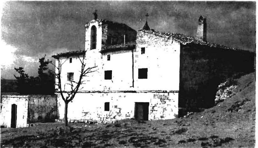
Fotografía núm. 8.—Nuestra Señora del Castillo, de Miranda de Arga.