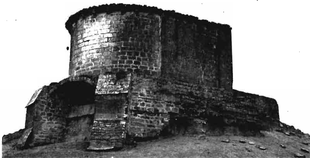
Fotografía núm. 9.—Santa Cruz, de Murillo el Cuende.