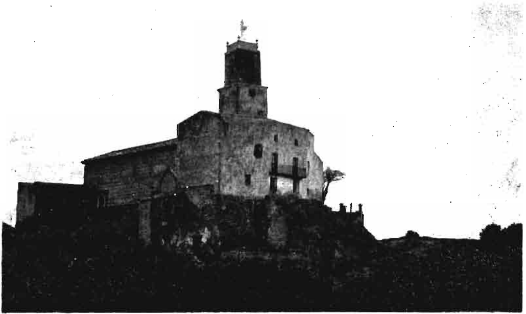
Fotografía núm. 3.—El Salvador del Mundo, de Falces.