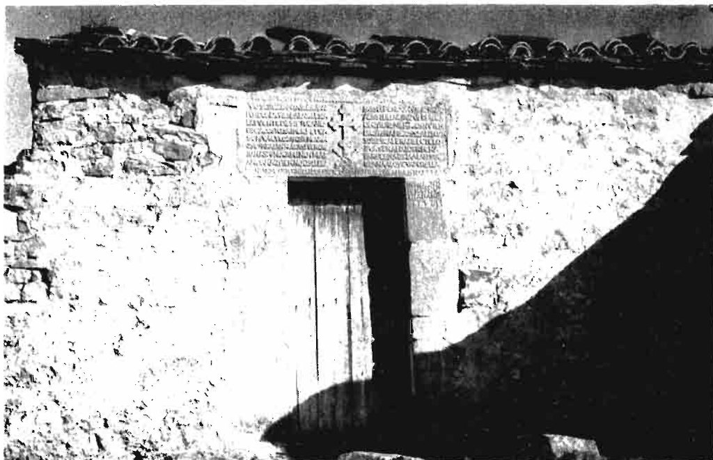
Fotografía núm. 11.—Santa Cruz, de Solchaga.