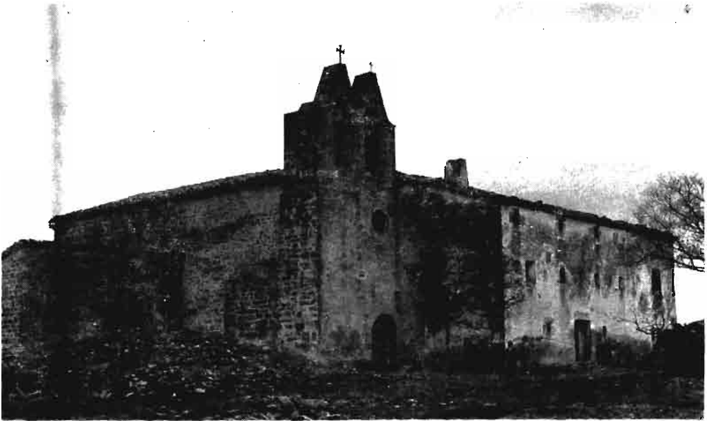
Fotografía núm. 6.—Nuestra Señora de Andión, de Mendigorria.