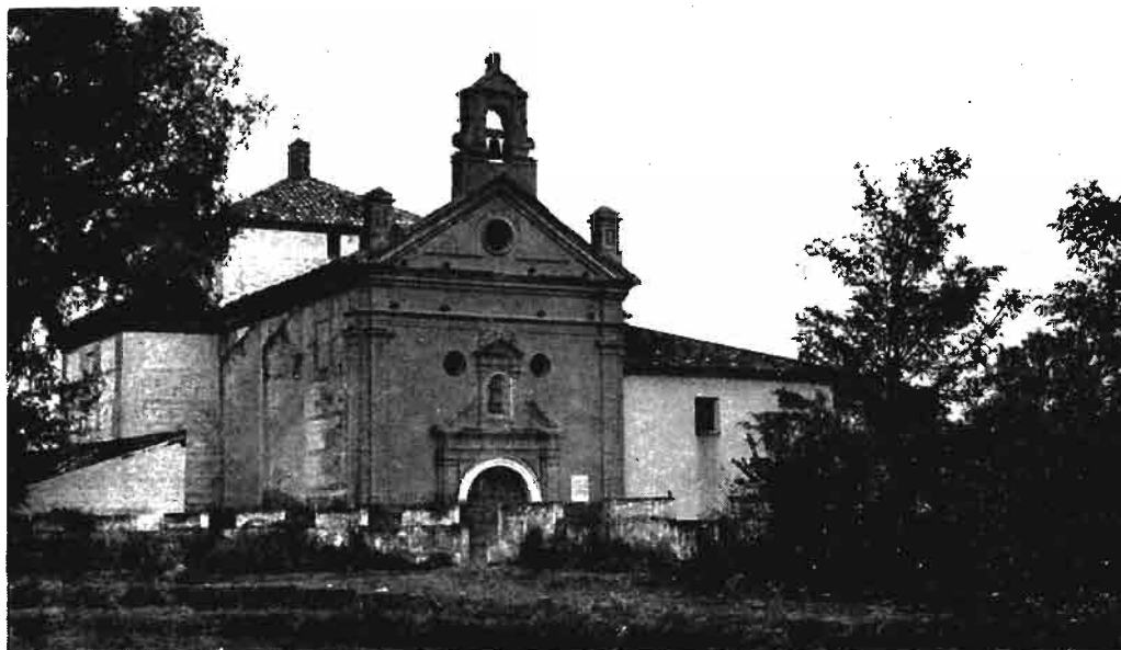
Fotografía núm. 2.—Nuestra Señora del Soto, de Caparroso.