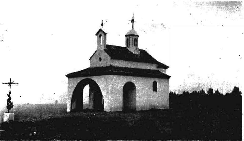
Fotografía núm. 4.—Nuestra Señora del Portegado, de Funes.