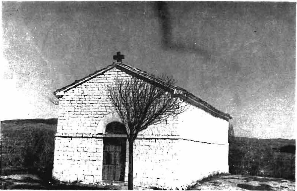
Fotografía núm. 14.—San Gregorio, de Tafalla.