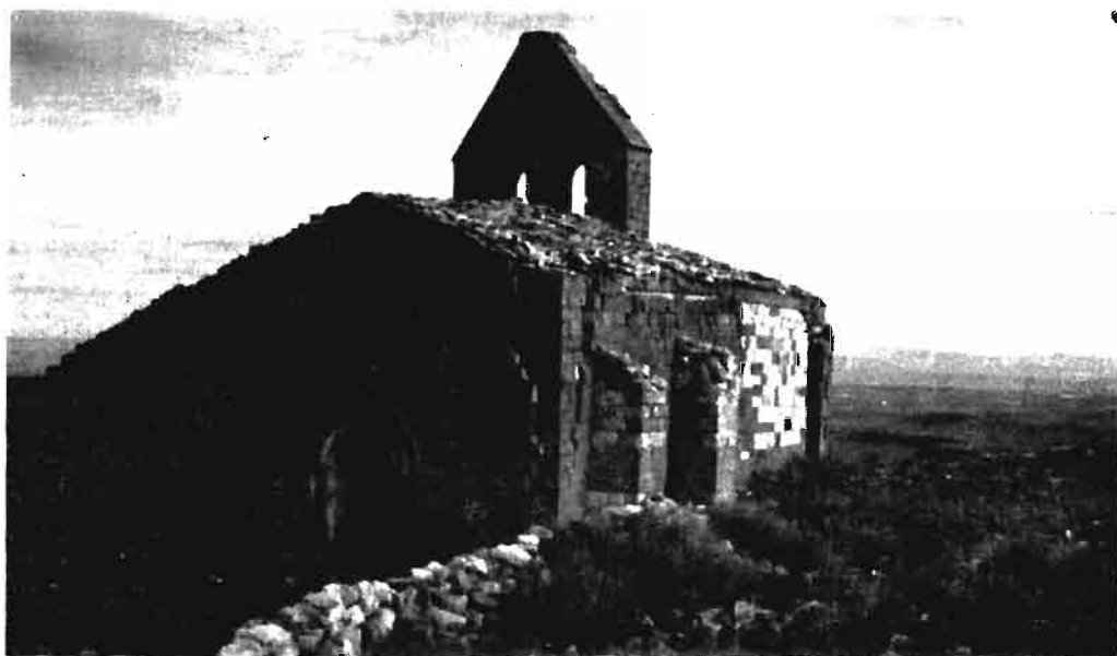
Fotografía núm. 15.—San Nicolás, de Traibuenas.