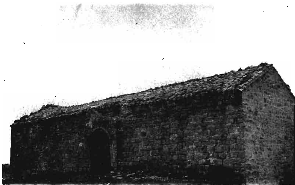
Fotografía núm. 16.—Nuestra Señora de la Blanca, de Uxue.