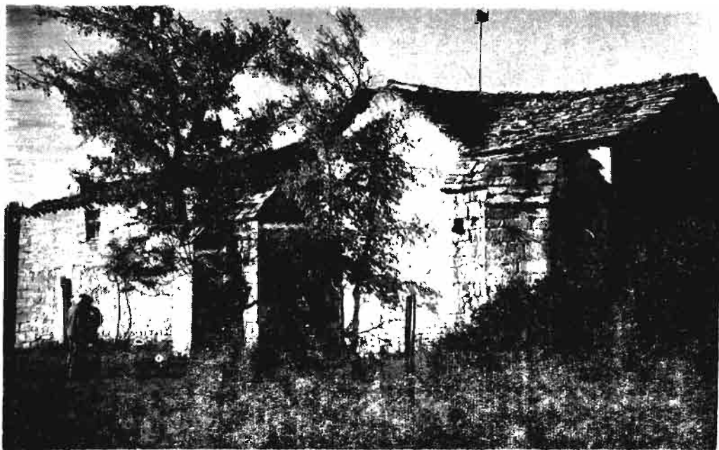
Fotografía núm. 10.—Santa Brígida, de Olite.