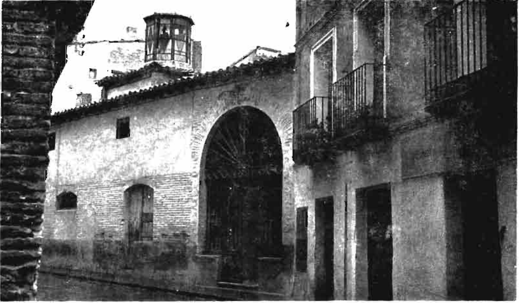
Fotografía núm. 5.—Nuestra Señora del Plu, de Marcilla.